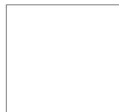
Immagine Incisione (facoltativa)